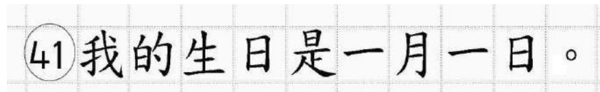
Рис.16. Образец написания иероглифических знаков

Записи в лист 1 и лист 2 бланка ответов № 2 делаются в следующей последовательности: сначала заполняется лист 1, затем заполняется лист 2. Записи делаются строго на лицевой стороне, обратная сторона листов бланка ответов № 2 по китайскому языку НЕ ЗАПОЛНЯЕТСЯ!!!